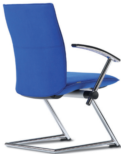
Tiger 5 A

EN Tiger. Active seating in optimum form.