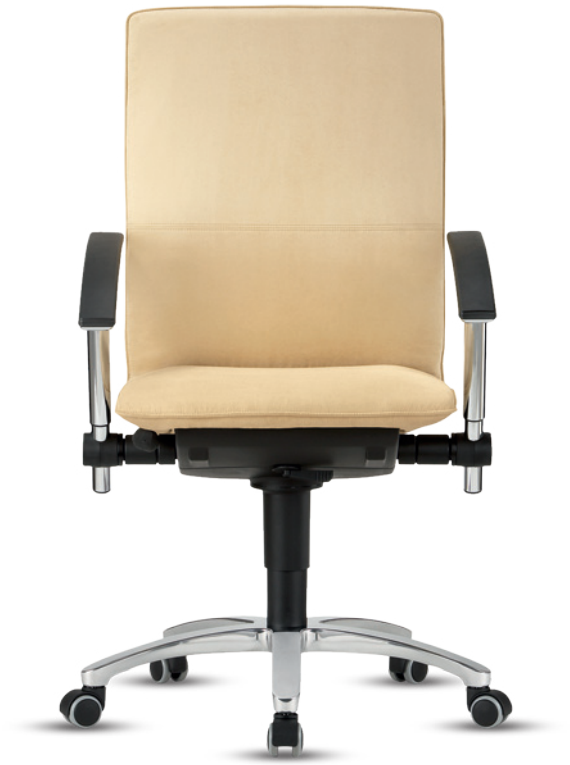
Tiger 6 HA